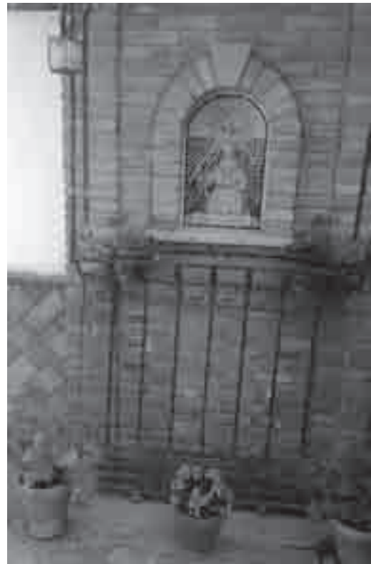
Capilla de la Virgen en un patio del pueblo.

San José, a pesar de tener una importante misión en la vida de Jesús y de María y por lo tanto en la historia de la salvación, pasa casi desapercibido en los Evangelios y en