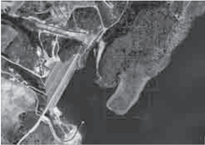
Localización del futuro embarcadero en las proximidades del muro de la Presa de Giribaile.

de restauración y ocio junto al muro de la presa de Giribaile.