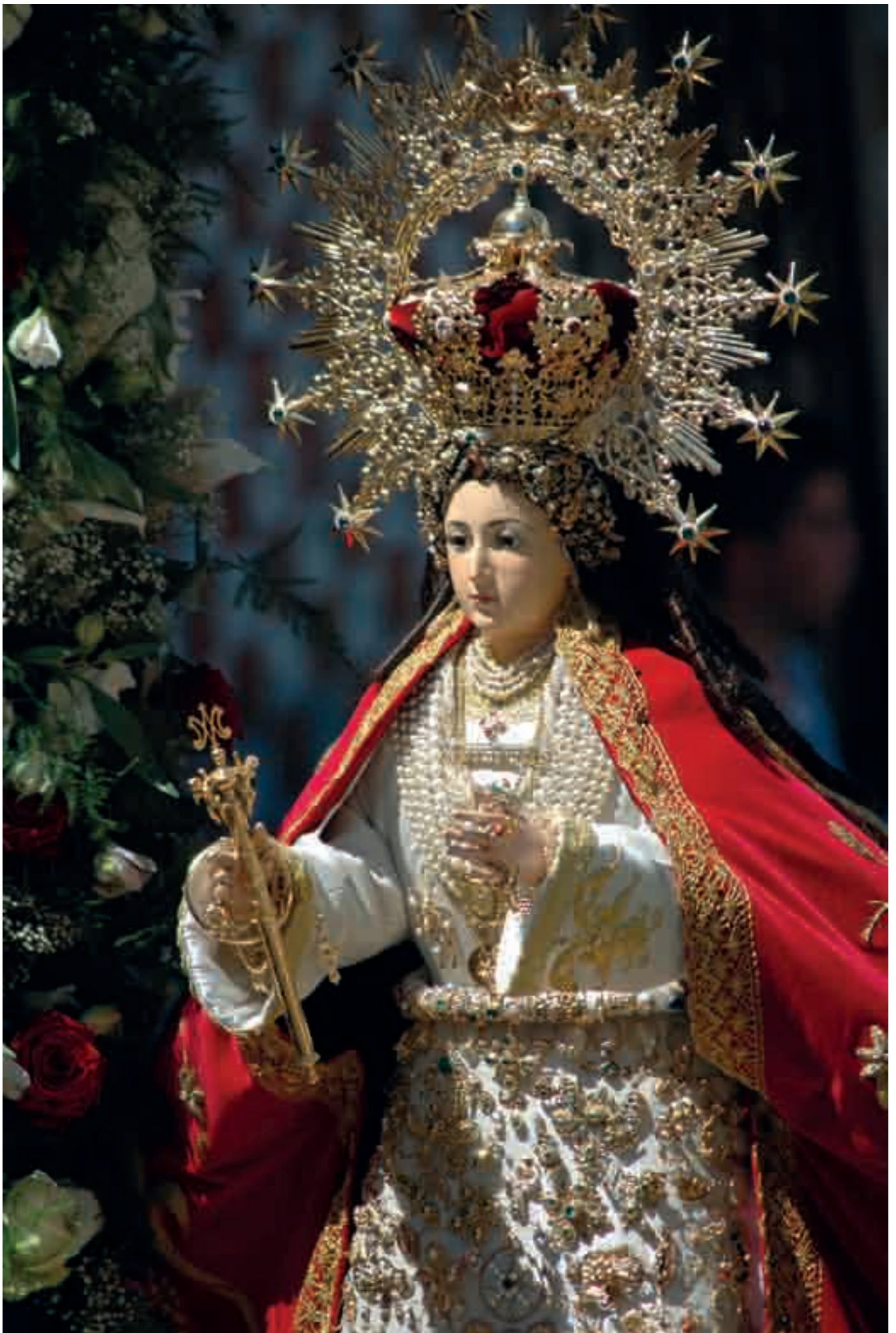
Segundo Premio VI Concurso de Fotografía 2013