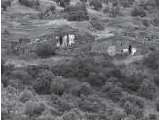
Vista general del oratorio de Valdecanales.

familias encargadas de la recogida de la aceituna y de otras labores del campo, sin saber que algunas de aquellas cuevas tenían un origen remoto que nos remite como poco a los albores de la Edad Media.