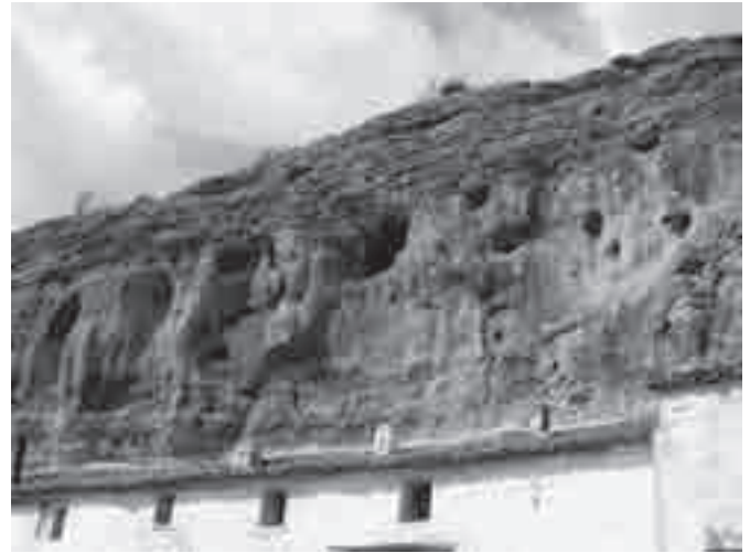
Cuevas de Giribaile antes del gran desprendimiento de roca en marzo de 2008.

Así, el nuevo interés que Giribaile suscitó hace ya casi un cuarto de siglo ha sido el motor que ha impulsado un renovado interés por recuperar la investigación arqueológica en la zona, abriendo nuevas vías de interpretación que permitan encontrar claves para explicar aspectos que hasta entonces no habían recaba-