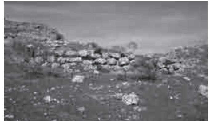
Muro ciclópeo de Giribaile.

castillo de Giribaile constituye el paralelo más cercano a la muralla de Ibro, compartiría con ella un mismo ambiente cronológico y, aunque por el momento resultaría aventurado ir más allá en la interpretación sobre su posible funcionalidad, podríamos apuntar que cuando se erigió ya había transcurrido un tiempo considerable desde que la ciudad ibérica o ibero-cartaginesa había sido destruida mediante un incendio como escenario que fue de una acción de castigo durante la Segunda Guerra Púnica. En todo caso, si podría afirmarse que se trata de una ocupación limitada a un sector de la antigua ciudad y su excavación podría ser de interés para avanzar en la conceptualización global de los aparejos ciclópeos, pudiendo relacionarlos con las secuencias y contextos originales en casos aparentemente bien conservados como el que representa Giribaile.